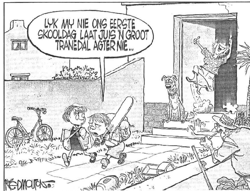
[Verwerk uit Die Burger , 17 Januarie 2018]

1.20 Wat bedoel die seuntjie as hy sê dat hulle eerste skooldag nie juis 'n groot tranedal agterlaat nie? (1)